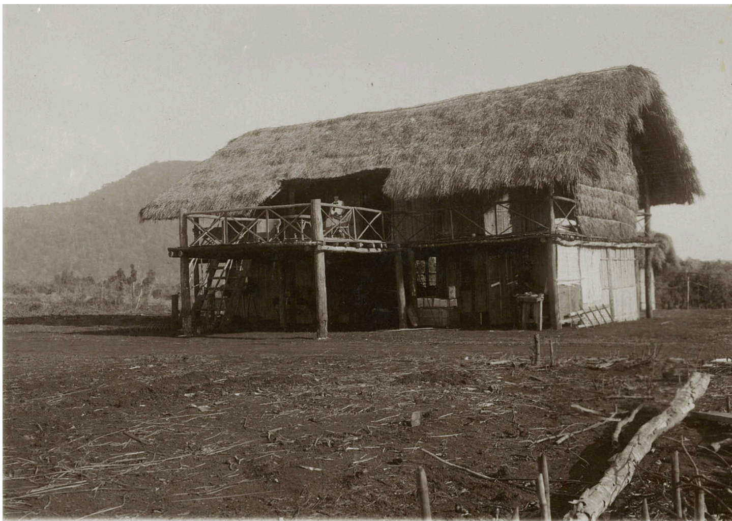
Bungalow de la mission