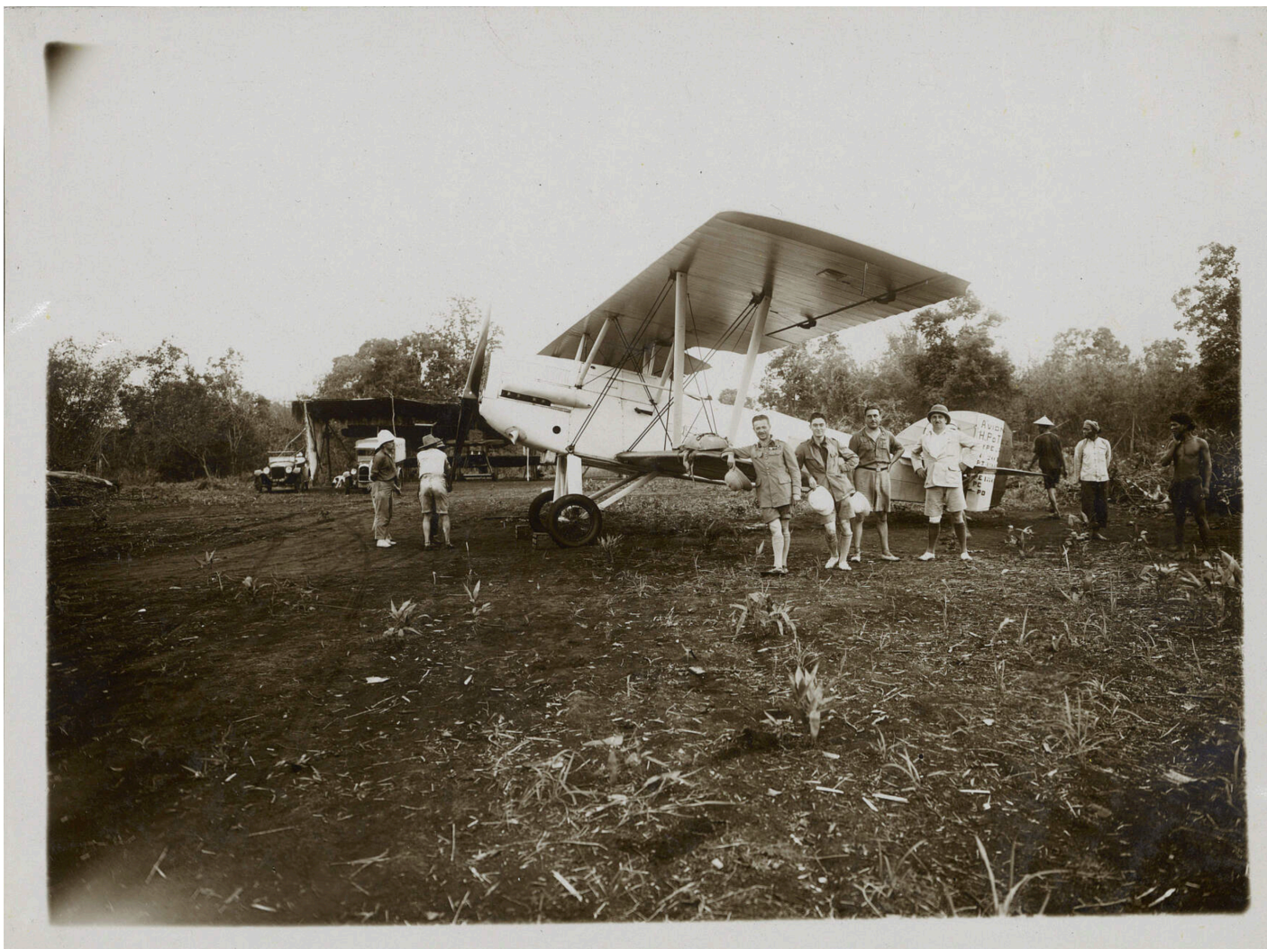
La charrette des hommes qui volent (Coll. ASEMI)