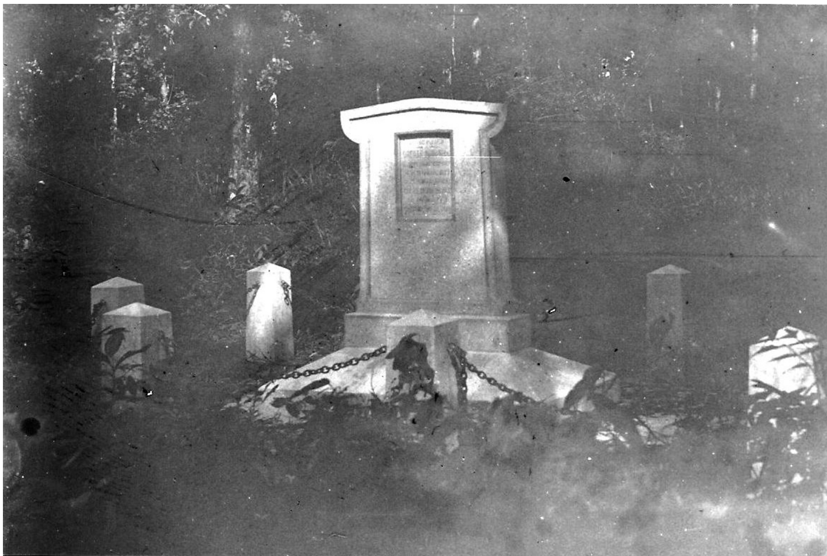
La stèle à Gatille. Série de plaques photographiques sauvées par Gérard O'Connell. Hélas, celle-ci est endommagée.