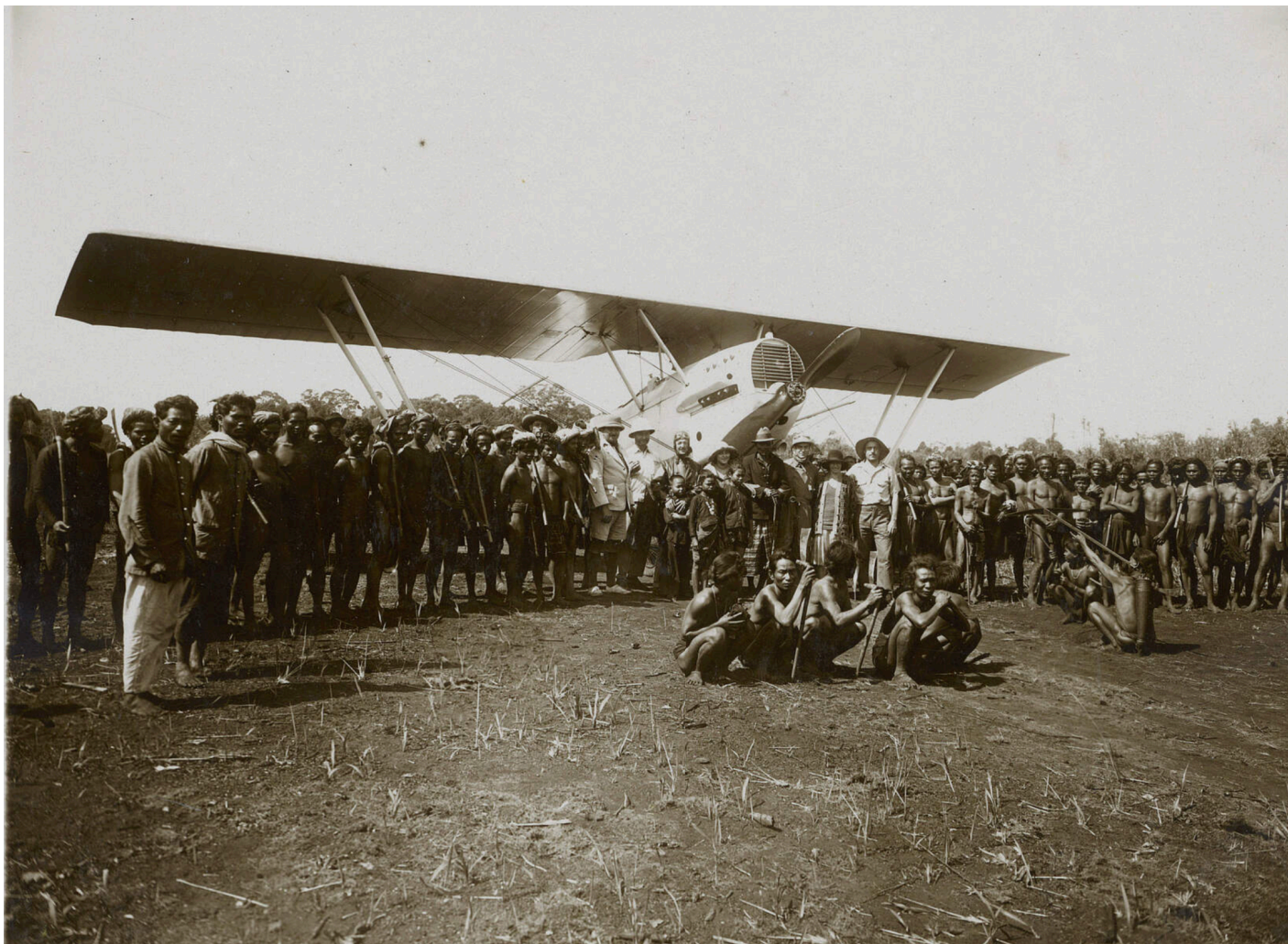
Les Moïs et la charrette des hommes qui volent