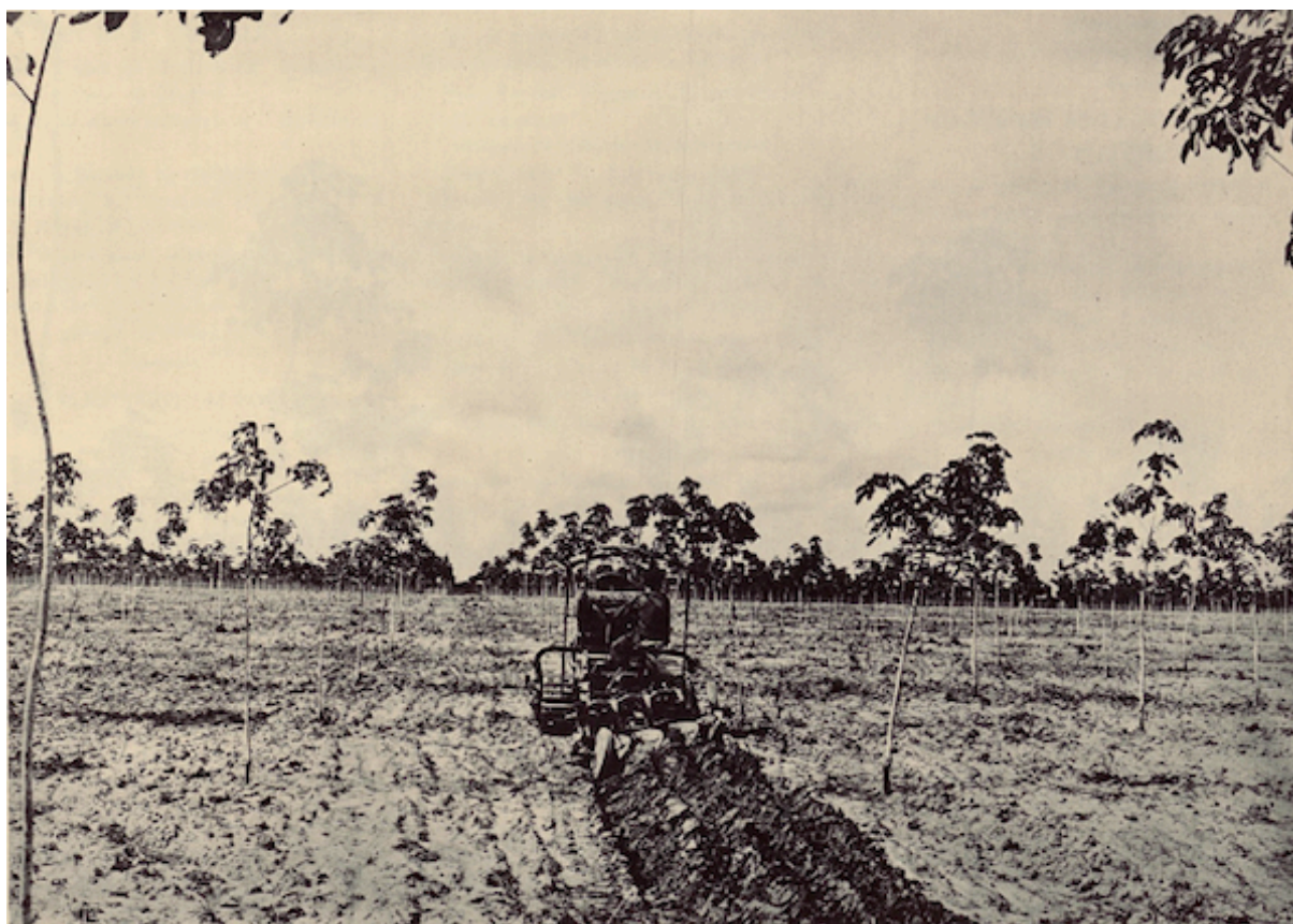
Planche 43. — Labour mécanique

L'exercice clos le 30 juin 1925 se solde par un bénéfice de 3.396.574 francs. Au bilan, on note un actif disponible de 2 millions 40.309 francs, non-compris 1.521.392 francs de stocks de caoutchouc et approvisionnements divers, alors que les exigibilités ne sont que de 578.362 francs.