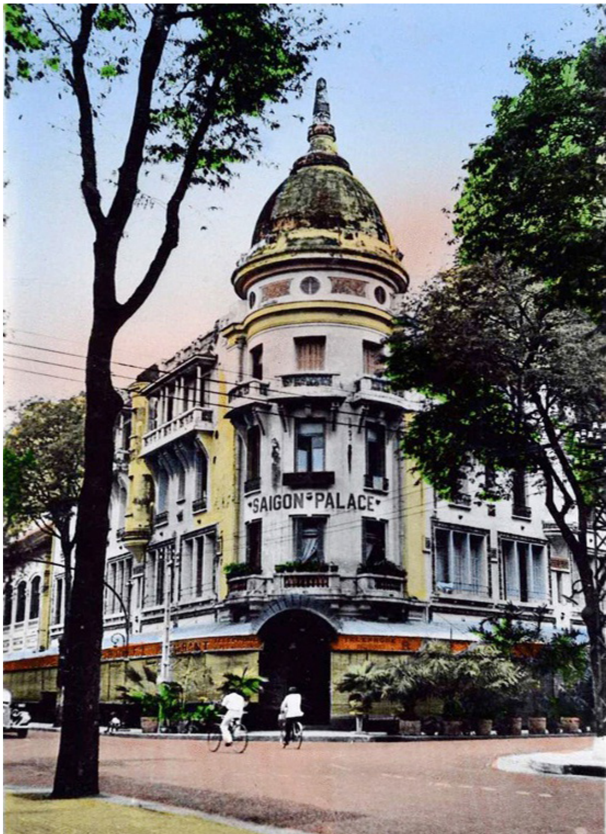
saigon-vietnam.fr/dong-khoi_fr.php Le Saigon-Palace abrita à la fin des années 1940 le cercle privé de la Maison des fonctionnaires.