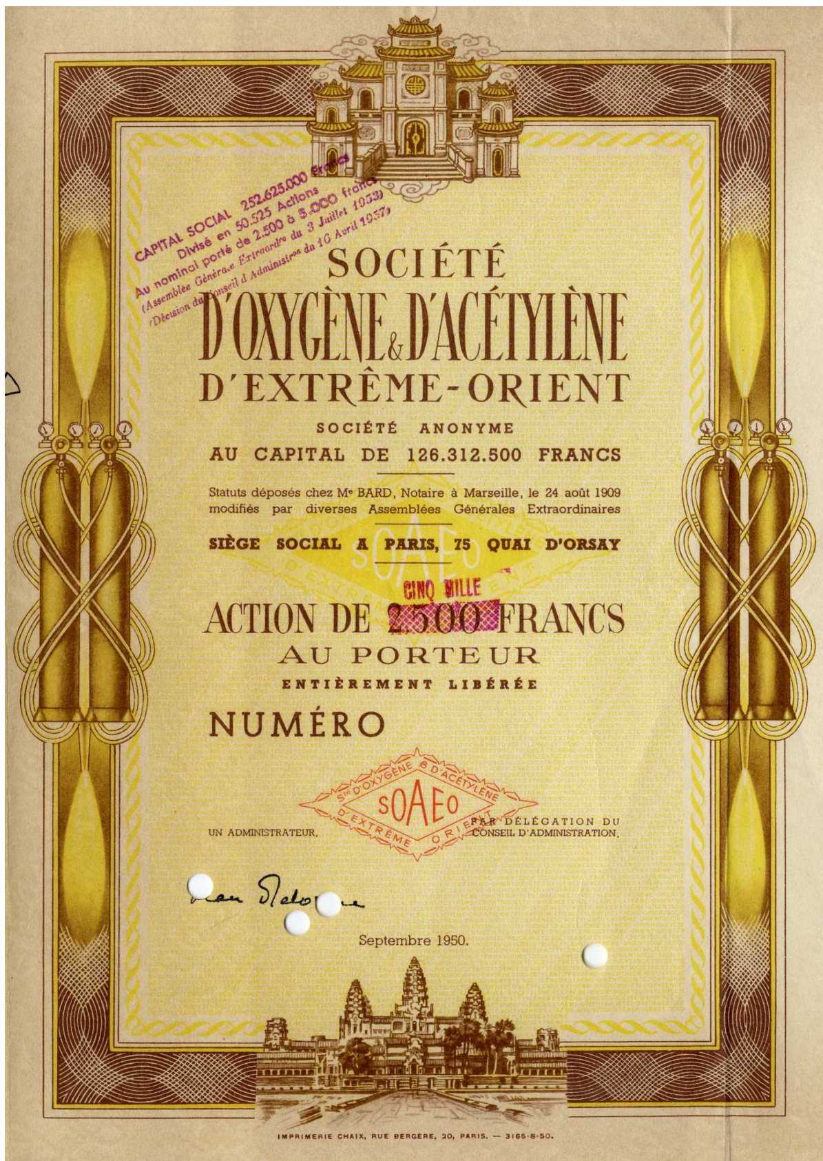
SOCIÉTÉ D'OXYGÈNE ET D'ACÉTYLÈNE D'EXTRÊME-ORIENT Société anonyme au capital de 126.312.500 fr.