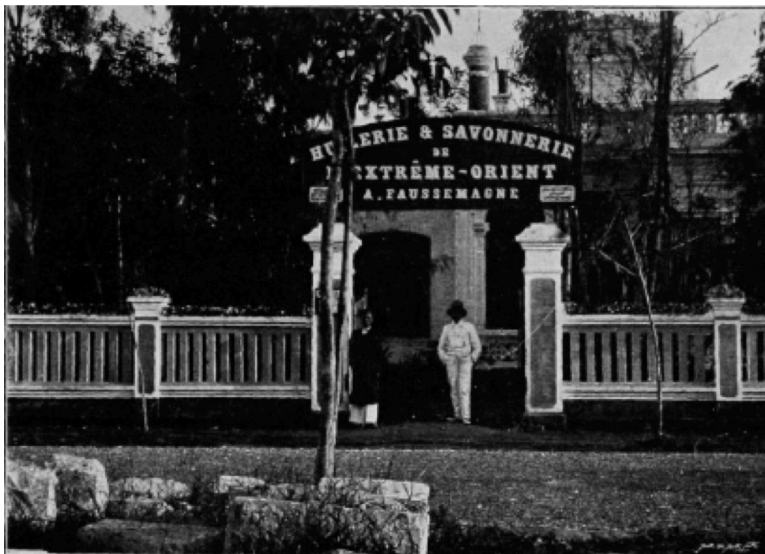
Entrée de la fabrique.

Fabrique d'Huilerie et Savonnerie de l'Extrême-Orient. (Robert Dubois, Le Tonkin en 1900 , Paris, Société française d'éditions d'art)