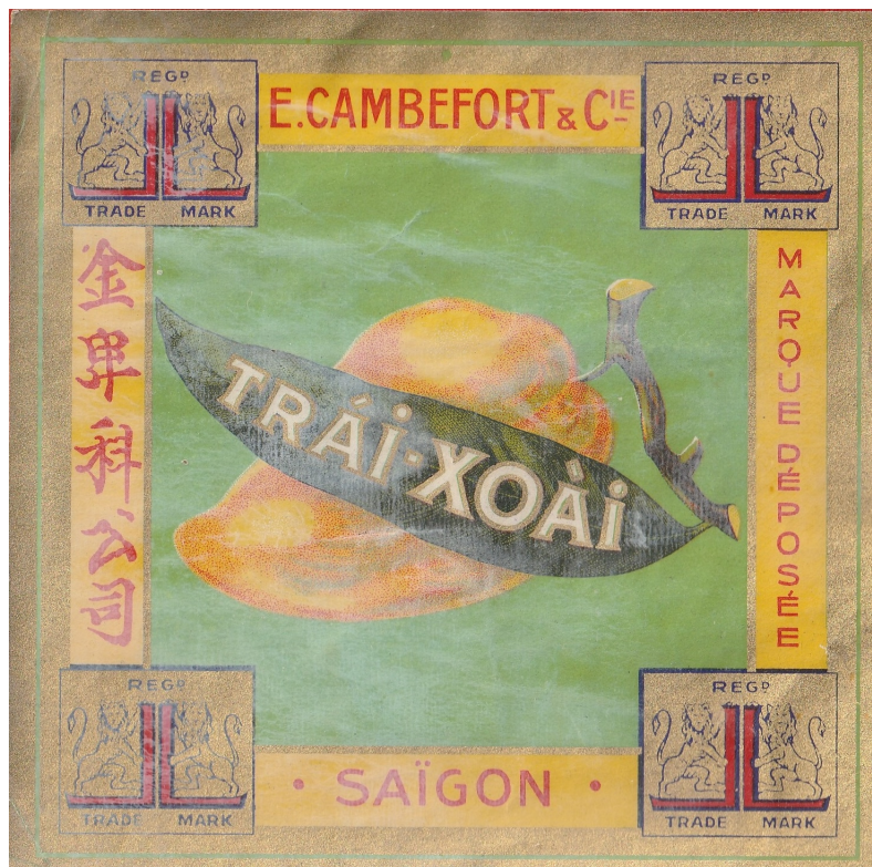
E. Cambefort & Cie, Saïgon Mangue Watson Imp.