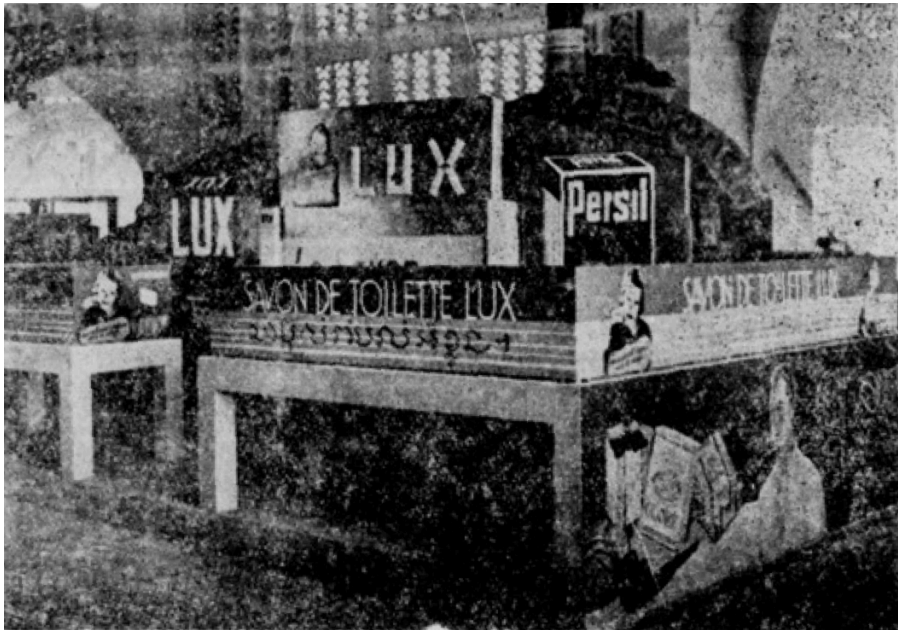
Savon de toilette Lux, lessive Persil

Les stands de la maison Denis frères ( La Vérité , n° spécial, 19 novembre 1937)