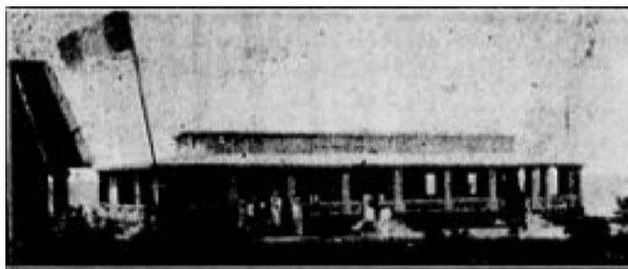
L'Hôtel de la Plage de Cua-Tung (Nord-Annam)