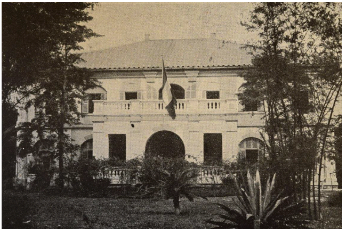
Chambre consultative mixte de commerce et d'agriculture de Tourane, L'Annam en 1906 , Marseille, Imprimerie Samat & Cie, 338 p.