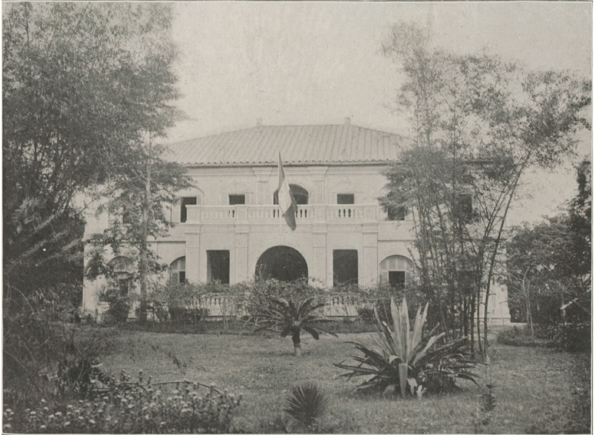
Agence de Tourane