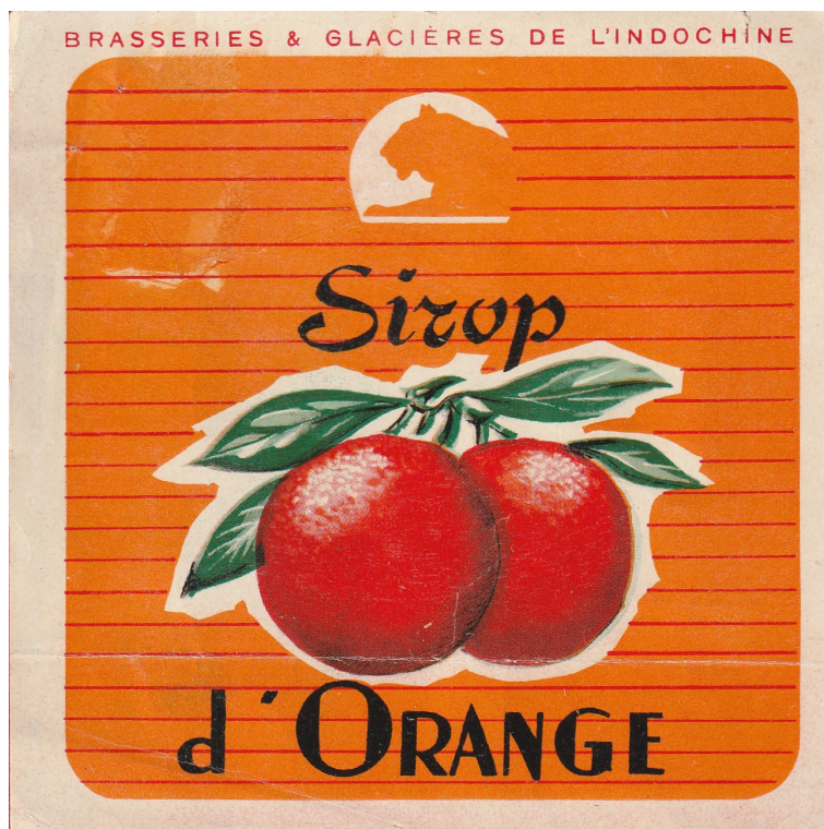
Étiquette sirop d'orange.