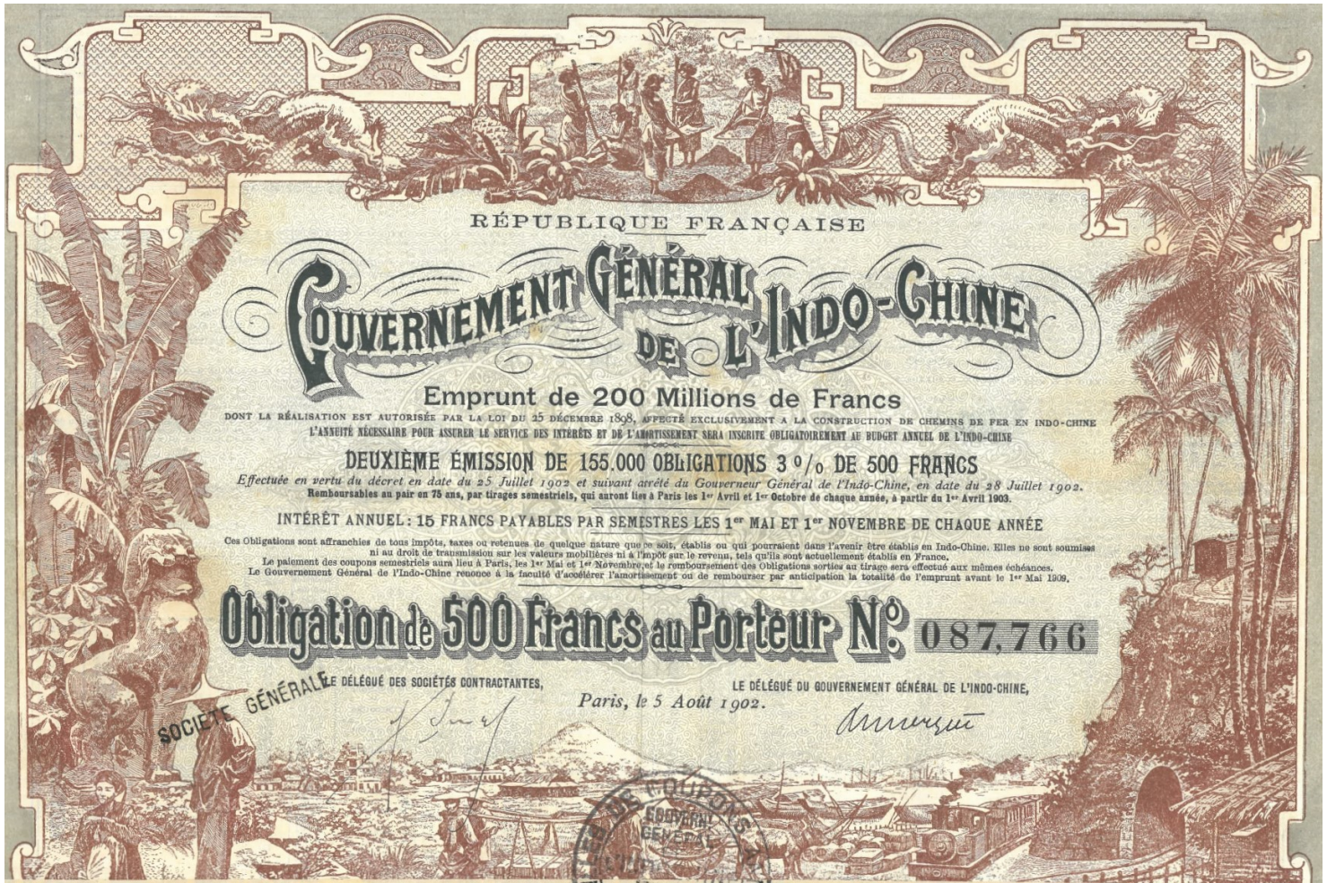
Obligation de 500 fr. au porteur du gouvernement général de l'Indochine, 5 août 1902