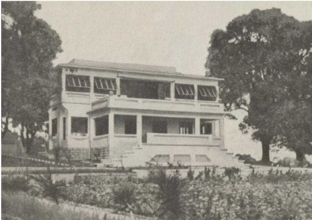
Siège social de la CAFRA à Pointe-Noire

Compagnie de l'Afrique française CAFRA ( Le Monde colonial illustré , novembre 1937, suppl., p. 108 a) (Anciennement ENTRACO & S.F.A.K.) Société anonyme au capital de 21.400.000 francs)