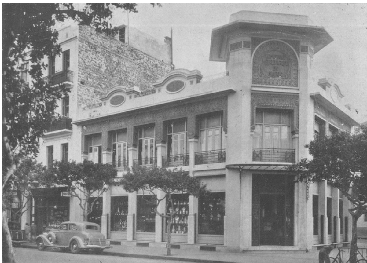
Maison principale à Casablanca

Société anonyme fondée en 1913 avec siège social à Lyon, dans le but d'importer et de vendre les produits métallurgiques.