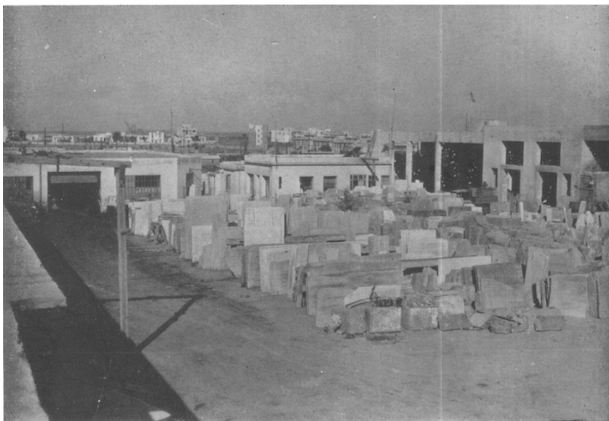
Un coin du parc aux tranches, usine de marbrerie, rue du Colonel-Scal, Casablanca