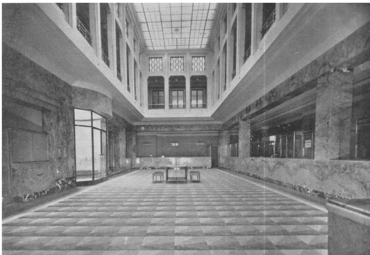
Revêtement de marbre du hall de la Banque commerciale du Maroc, à Casablanca