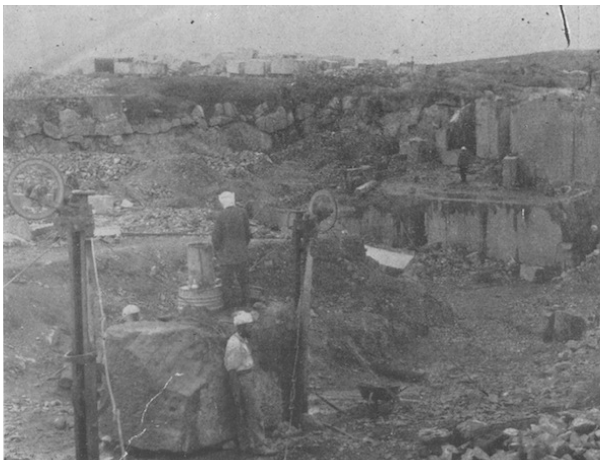
Carrière de marbre noir veiné Khenig de la Société des Carrières marocaines