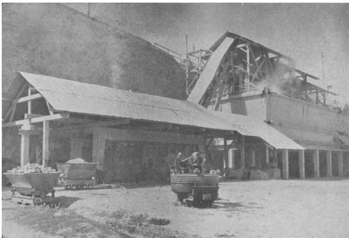
Une installation de broyage de quartzite à El Hank (Casablanca)